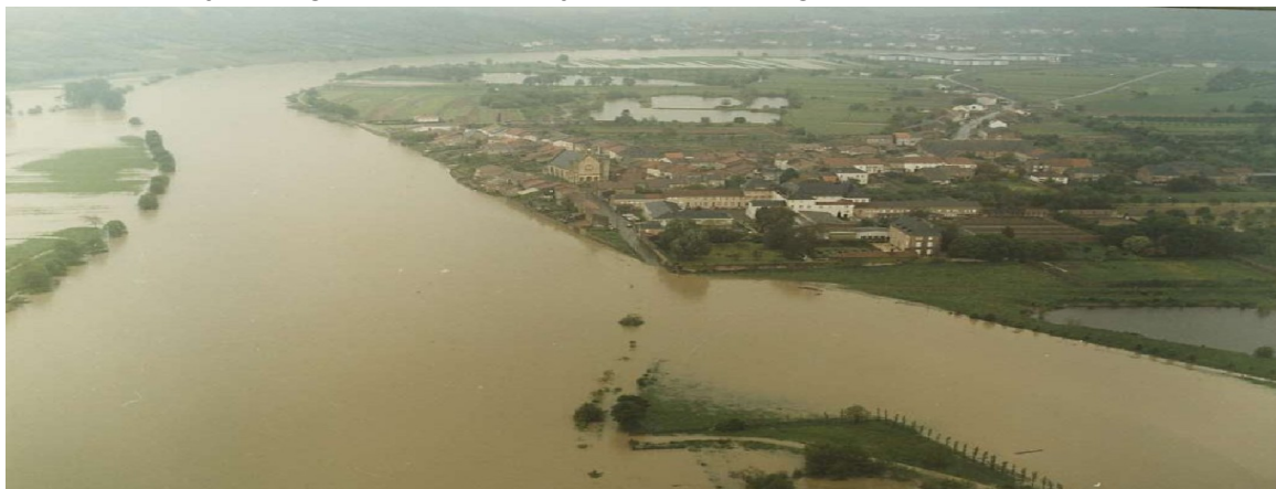
Commune de Rettel – Crue de mai 1983