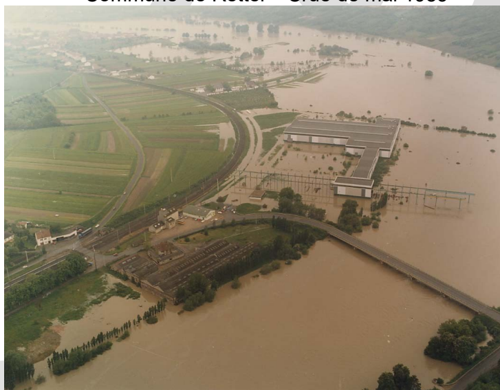
Commune de Rettel – Crue de mai 1983